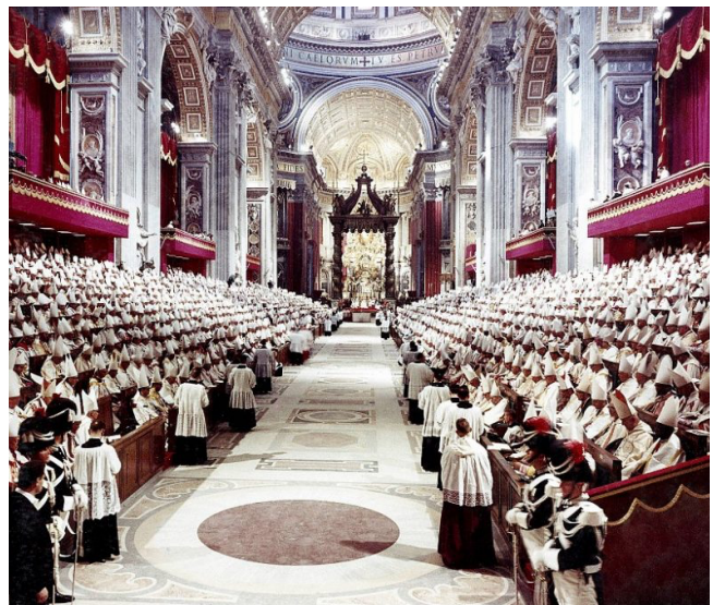
Ouverture du concile Vatican II, St-Pierre de Rome, 1962 © Farabola/Leemage.

Les signes des temps se discernent en famille, entre voisins, entre collègues, en communauté, en paroisse, au plus près des réalités quotidiennes où se répercutent les