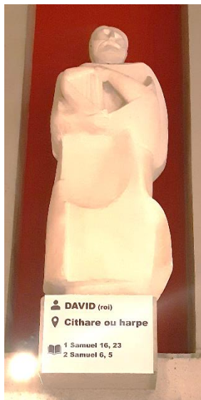
DAVID (roi) Cithare ou harpe 1 Samuel 16, 23 2 Samuel 6, 5