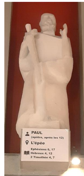
PAUL (apôtre, après les 12) L'épée Ephésiens 6, 17 Hébreux 4, 12 2 Timothée 4, 7

N'hésitez pas à monter dans le chœur munis de votre Bible pour (re)découvrir ces douze figures bibliques.